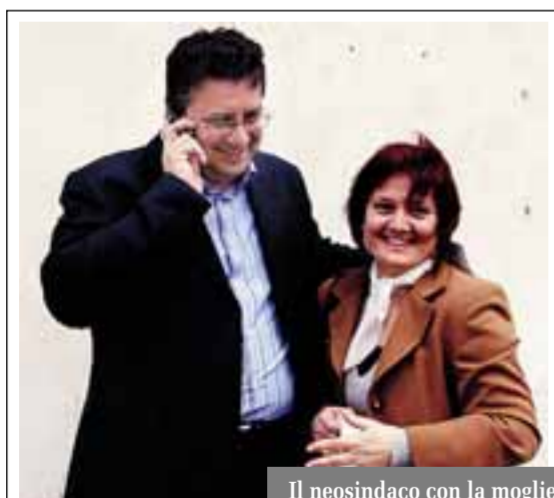
Il neosindaco con la moglie