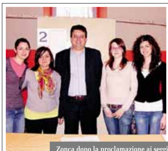
Zonca dopo la proclamazione ai seggi